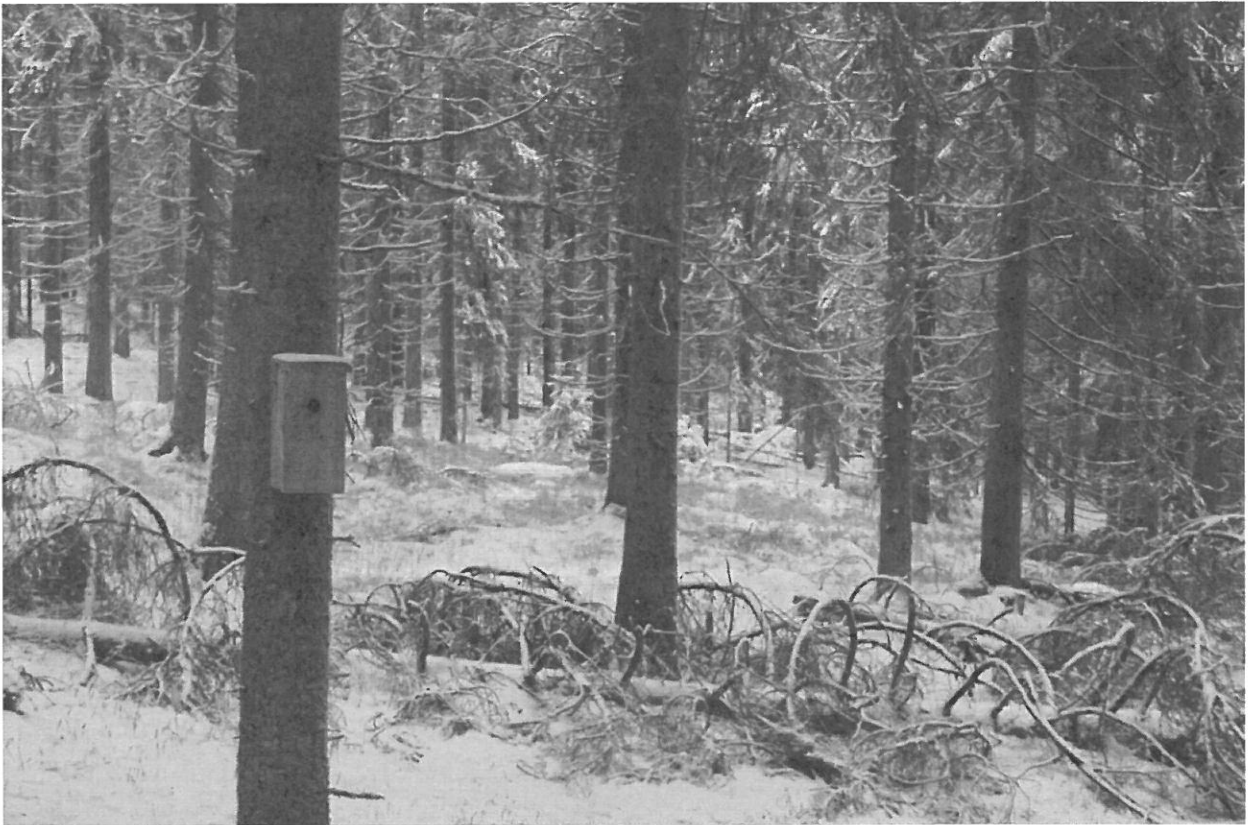
Kuva kuviolta 19.

lintutieteellisen yhdistyksen (Liite 2) yhteistyössä Hollolan ympäristöyhdistyksen kanssa Hollolan kunnan avustuksen turvin ripustamat lähes 100 linnunpönttöä.